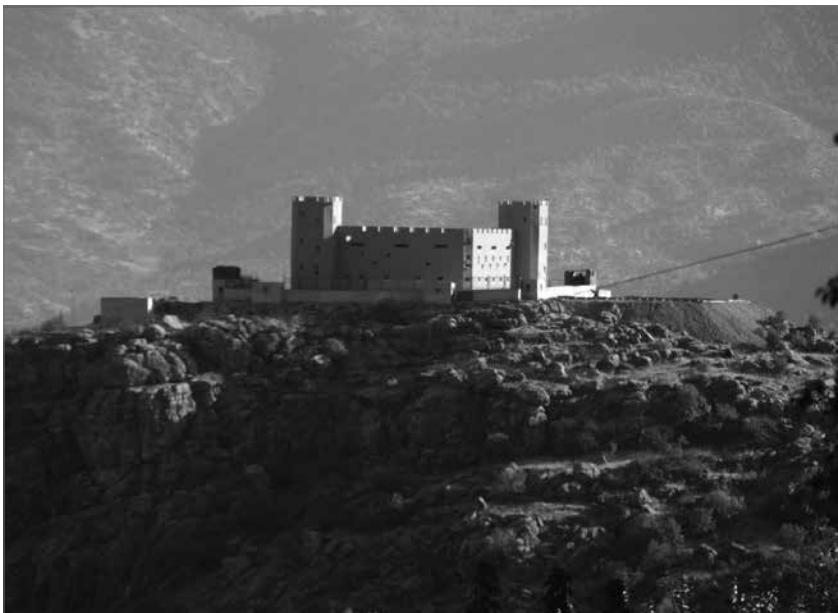
Trotz »Friedensprozess« und Versuch einer Lösung der kurdischen Frage baut die Regierung ihre Militärposten zu großen Befestigungsanlagen aus.

Als die Arbeit an der Verfassung begann, saßen Tausende Mitglieder und Funktionäre der BDP in den Gefängnissen, und durch ständige Razzien und Operationen versuchte man sie an ihrer Politik zu hindern. Hier schlug die BDP der AKP eine »Wegbereinigung« vor. Danach sollten die Einschränkungen der Grundfreiheiten der Menschen durch die antidemokratischen Gesetze abgeschafft werden, um eine erfolgreiche Arbeit an der neuen Verfassung zu gewährleisten. Als erste Schritte wurden hier Änderungen an den Antiterrorgesetzen und dem Strafgesetzbuch, die Abschaffung des Dorfschützersystems, die Rückbenennung Zehntausender kurdischer Ortschaften mit ihren ursprünglichen Namen angeführt. Trotz der vergangenen zwei Jahre sind keine Lösungen für diese Fragen gesucht worden, vielmehr versuchte die Regierung, mit sogenannten [ »Reform-« oder »Demokratie-« ]/Paketen, die kurdischen politischen Kräfte, ohne sie an der Erstellung zu beteiligen, hinzuhalten.