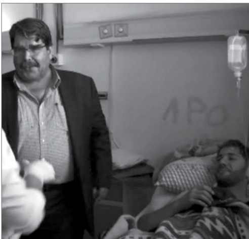
Der Krieg in Rojava fordert weiter viele Opfer. Der Kovorsitzende der PYD Salih Muslim besucht Verletzte im Krankenhaus.