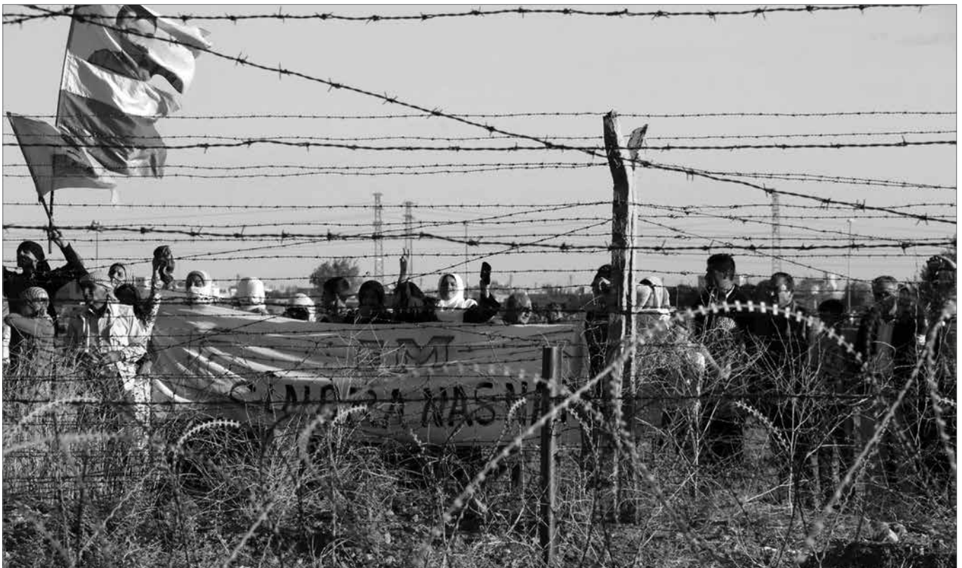
»Wir kennen keine Grenzen!« – Die Bevölkerung von Rojava protestiert an der Grenze zu Nordkurdisten gegen den Baubeginn einer Grenzmauer. Auf beiden Seiten der Grenze kamen Tausende zusammen, um das Projekt, das von der Türkei durchgeführt wird, zu stoppen.

Die zivilen Toten und die Flüchtlingskrise werden in den Hintergrund gedrängt, als spielte die humanitäre Katastrophe nur die zweite Geige in dieser Kriegsmelodie. Die Aufmerksamkeit der Medien richtet sich nun auf den Abbau des Chemiewaffensystems von Syrien und applaudiert den ehemaligen Kalter-Krieg-Veteranen zu ihrem scheinbaren diplomatischen