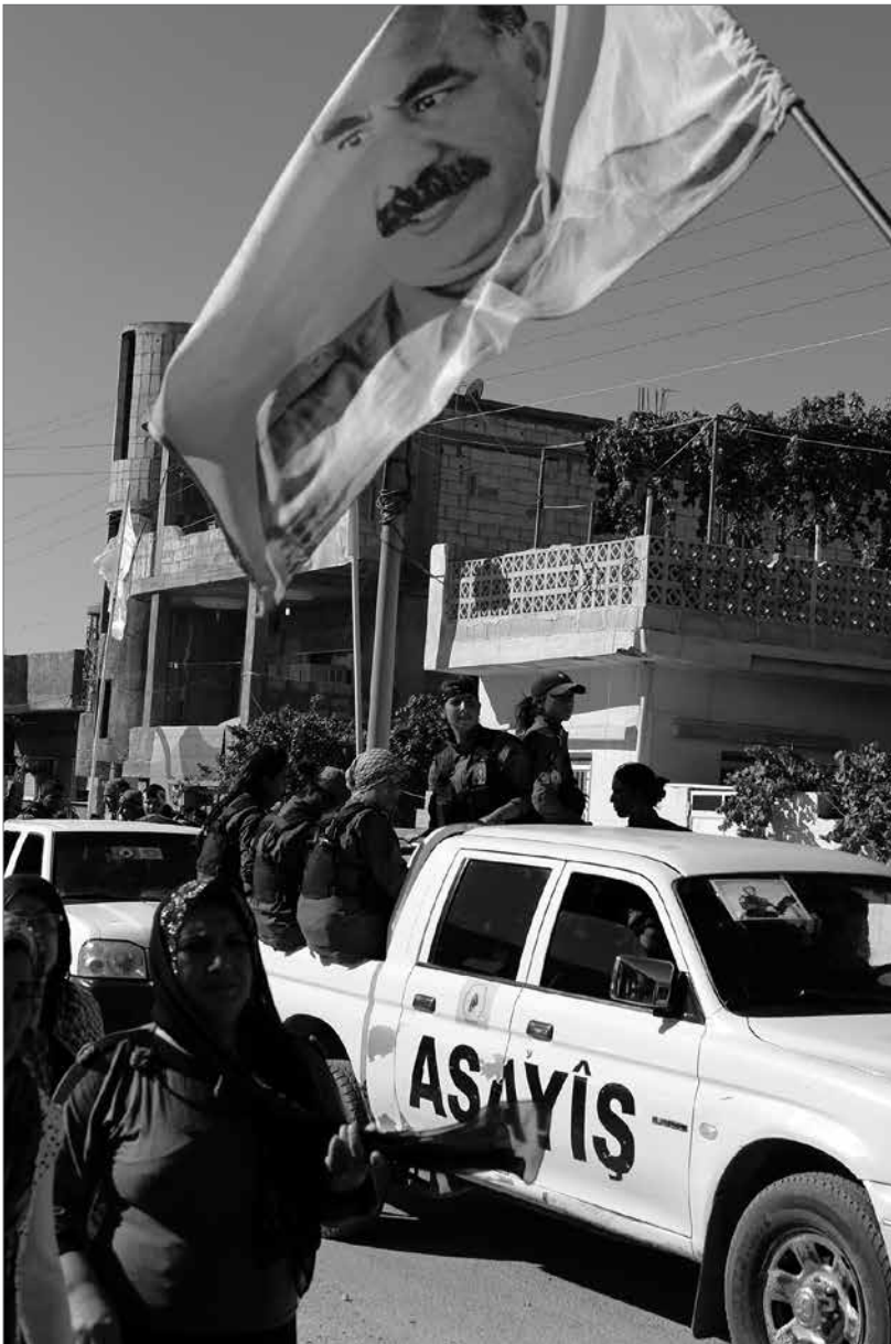
Auch in den Einheiten der Asayîs, Sicherheitskräfte der westkurdischen Rätebewegung, sind die Frauen stark vertreten.

arabische und assyrische Frauen. Schätzungen zufolge verfügen die YPJ über 2000 Kämpferinnen im Alter zwischen 18 und 45 Jahren. In jeder Stadt gibt es Frauenzentren der YPJ und Frauenselbstverteidigungsakademien. 21