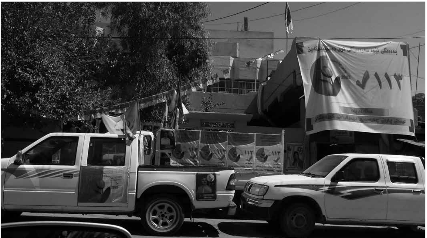
Wahlkampfbüro der PCKDK in Silêmani

Landwirtschaft, Tierzucht, Bauunternehmen und Fabriken werden so zunehmend ausländischen Unternehmungen überlassen. Ein Grund, warum viele kurdische Jugendliche keine Arbeit und Perspektive besitzen. Sie sind von staatlichen Geldern abhängig, die in geringem Ausmaß zur Existenzsicherung