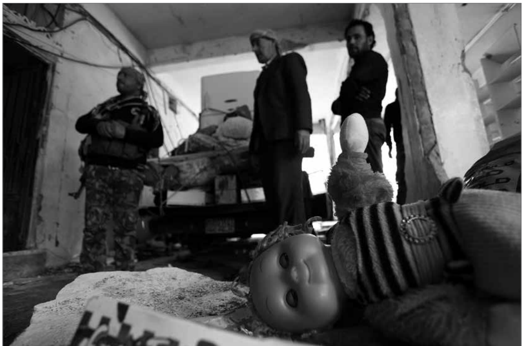
Die Zivilbevölkerung musste wegen der Angriffe der Dschihadisten in Serê Kaniyê viele Häuser verlassen.

Die Folge ist, dass der ENKS sich wieder zusammenreißen muss und seine Arbeit im Kurdischen Hohen Rat fortführen muss. Denn auch die Mitglieder des ENKS wissen, dass die Bevölkerung Rojavas es ihnen nicht verzeihen würde, wenn sie in einer Phase, in der die Angriffe der islamistischen Gruppierungen auf die kurdische Bevölkerung so stark sind, die kurdische Einheit einer weiteren Gefahr aussetzen würden. Und auch die Türkei will wohl die »Notlösung«, den Kurdischen Hohen Rat und damit auch die Errungenschaften der kurdischen Bevölkerung in Rojava anzuerkennen, nicht völlig aus der Hand geben. Dieser Schluss lässt sich aus dem Empfang der Mitglieder des Kurdischen Hohen Rates in Ankara von Mitte September ziehen. Ob die Türkei am Ende wirklich die KurdInnen in Syrien akzeptieren wird, darüber lässt sich spekulieren. Sicher ist, dass all ihre Versuche, das zu umgehen, bisher gescheitert sind. Und die Unterstützung islamistischer Gruppen im Kampf gegen KurdInnen gestaltet sich auch immer schwieriger, zumal den westlichen Bündnispartnern der Türkei die Vorherrschaft der Islamisten unter der syrischen Opposition starke Kopfschmerzen bereitet. Sollten die KurdInnen also weiterhin ihre Gebiete gegen Al-Nusra und Co. erfolgreich verteidigen, wird es für ihre Gegner sehr schwer, die Errungenschaften der Revolution von Rojava zunichtezumachen. ♦