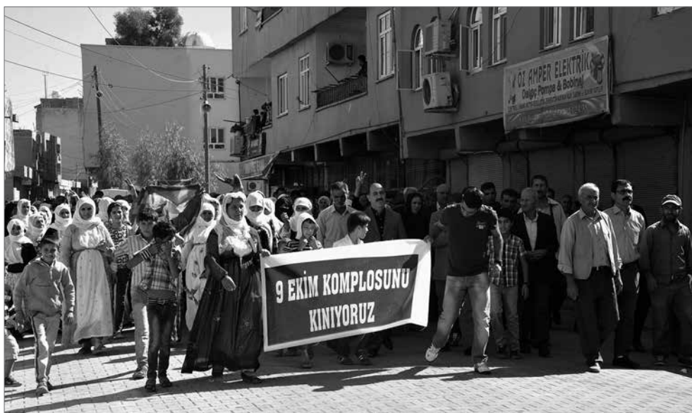
Am 9. Oktober 1998 verließ Abdullah Öcalan aufgrund internationalen Drucks Syrien und es begann eine Odyssee durch verschiedene (europäische) Länder. Tausende Kurdinnen und Kurden protestieren seitdem an diesem Tag gegen die internationale Verschwörung, mit der Öcalan verhaftet und auf die Gefängnisinsel Imralı verschleppt wurde. Ziel dieser Verschwörung war die Zerschlagung der kurdischen Freiheitsbewegung.

Nicht zu Unrecht wird das Paket als Wahlpaket der AKP beschrieben. Der Kovorsitzende der KCK Cemil Bayik sagte dazu: »Mit diesem Paket hat die Regierung erneut bewiesen, dass sie die kurdische Frage nicht verstanden hat und sich dem auch nicht ernsthaft annähert. Das Paket hat gezeigt, dass die AKP nicht die Lösung, sondern die Lösungslosigkeit als Politik verinnerlicht hat. Mit den Punkten, die im Paket aufgenommen wurden, soll die Gesellschaft hingehalten werden, bis erneut eine Wahl [gemeint sind die Kommunalwahlen im März nächsten Jahres, Anm. der Autorin] gewonnen wurde. Die AKP-Regierung hat in keiner Weise die unternommenen Schritte des kurdischen Volksvertreters Öcalan und der kurdischen Befreiungsbewegung für die Lösung der kurdischen Frage und einen dauerhaften Frieden berücksichtigt. Die Regierung versucht, die eingeleitete Phase der militärischen Gefechtslosigkeit und die Lösungsbasis dazu zu nutzen, um Zeit zu gewinnen und ihre Position zu stärken, um den Vorsitzenden Öcalan zu instrumentalisieren und die kurdische Freiheitsbewegung zu vernichten. Diese Form der Annäherung allein bedeutet, die Friedensphase Abdullah Öcalans zu sabotieren.«