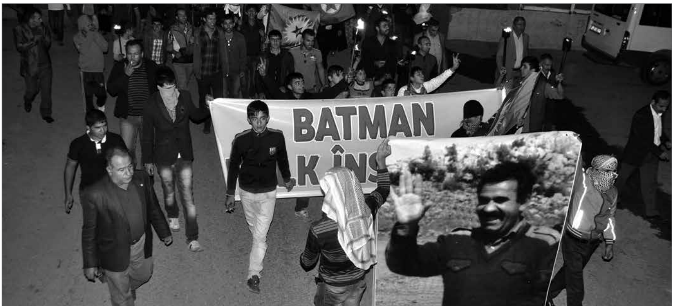
Demonstration in Êlih (Batman) am 9. Oktober mit der Forderung nach Frieden und der Freilassung von Abdullah Öcalan.

Der kurdischen Seite geht es um viel mehr als das Schweigen der Waffen. Das hat die kurdische Guerilla bereits so oft