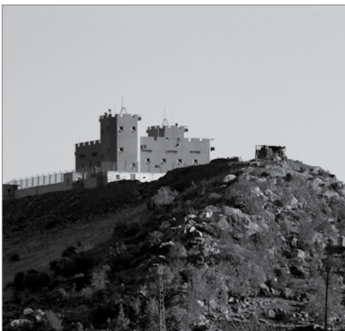
Will eine Regierung, die solche militärischen Anlagen baut, wirklich Frieden oder nutzt sie nur den Waffenstillstand, um ihre Position zu verbessern?