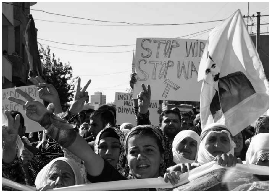
Gegen den Bau einer Grenzmauer zwischen Nordkurdisten und Rojava (Türkei/Syrien) protestieren tausende Menschen auf beiden Seiten der Grenze.

Seit genau 20 Jahren werden immer wieder Schritte unternommen, um die Gewaltspirale in der kurdischen Frage zu durchbrechen und ein historisches Hauptproblem der Türkei und der Region mittels Dialog zu lösen. Die Newroz-Erklärung des kurdischen Volksvertreters Abdullah Öcalan stellt einen weiteren Schritt und zugleich den Höhepunkt dieser 20-jährigen Friedensbestrebungen dar. Im Rahmen eines ausgearbeiteten Fahrplans, der sich in drei Etappen unterteilt, hat die kurdische Befreiungsbewegung einen Waffenstillstand verkündet und ab Mai mit dem Rückzug der Guerillaeinheiten außerhalb der türkischen Staatsgrenzen begonnen. [s. KR 167].