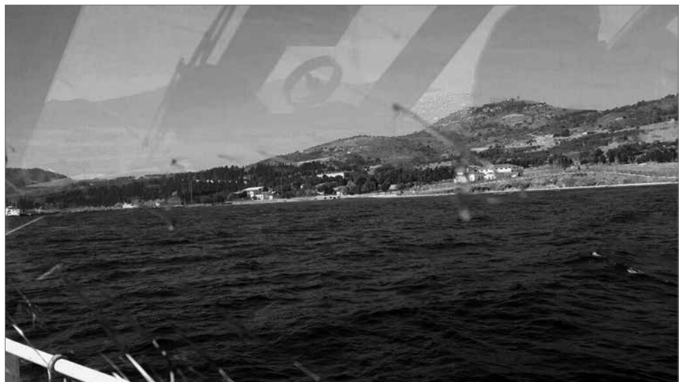
Blick von der Fähre aus auf die Gefängnisinsel Imralı

Bei diesem Thema hat er besonders die Haltung Barzanîs kritisiert. Er agiere machtfokussiert und das sei nicht im Sinne