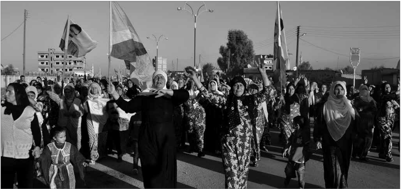
Frauen in Rojava sind die Spitze der Revolution, ob jung oder alt, sie kämpfen für ihre Freiheit.