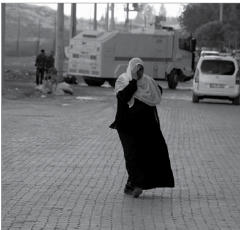
Zwischen Nordkurdistan und Rojava (Türkei/Syrien) baut die Türkei eine Grenzmauer. Dagegen protestiert die Bevölkerung auf beiden Seiten der Grenze.