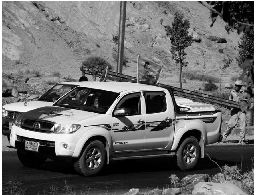
Wahlkampf auch in Qandil.

Der bislang stille Unmut in der Gesellschaft, die lauter werdende Kritik an der korrupten Politik und der Wirtschaft der kurdischen Herrschenden werden die treibende Kraft der Demokratisierung von unten sein. Der Unmut stieg vor allem nach der PDK-Politik in Bezug auf Rojava (Westkurdistan/